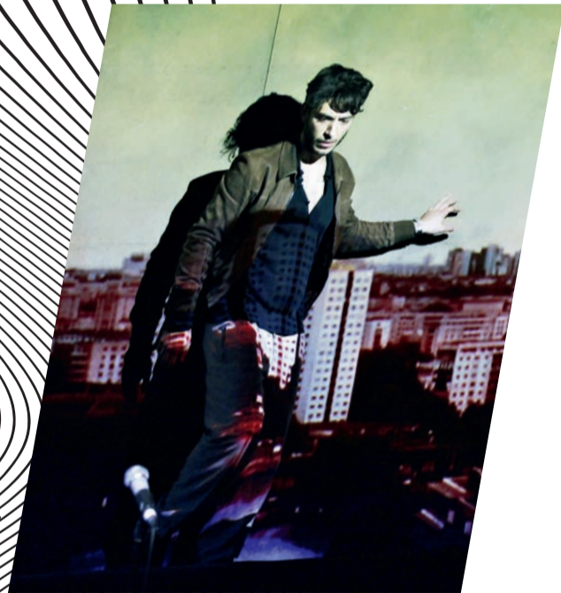
Maxim Gorki Theater Mrzutí