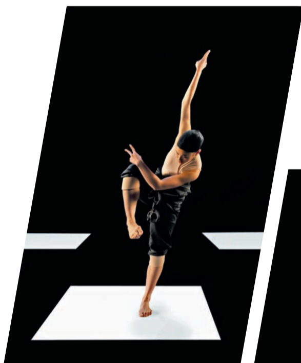
Nederlands Dans Theater 2

Délka představení: 2 h 15 minut se 2 přestávkami