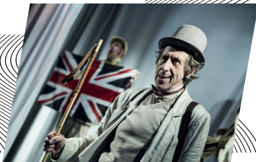
Divadlo Drak Amundsen kontra Scott

Svědomitý úředník Adolf Eichmann, zodpovědný za vyhlazení milionů Židů za 2. světové války, byl teprve v roce 1960 unesen komandem Mosadu z Perónovy nacismu přející Argentiny a v roce 1962 popraven, svou vinu však nikdy nepřiznal. Hlavní iniciátor řešení konečné židovské otázky má totiž svou vlastní verzi skutečnosti. Touží ji přednést Bohu, ten však nepřichází. Hra získala Cenu divadelní kritiky za inscenaci roku 2015. Komorní scéna Aréna byla oceněna jako divadlo roku. Délka představení: 2 h 20 minut s přestávkou