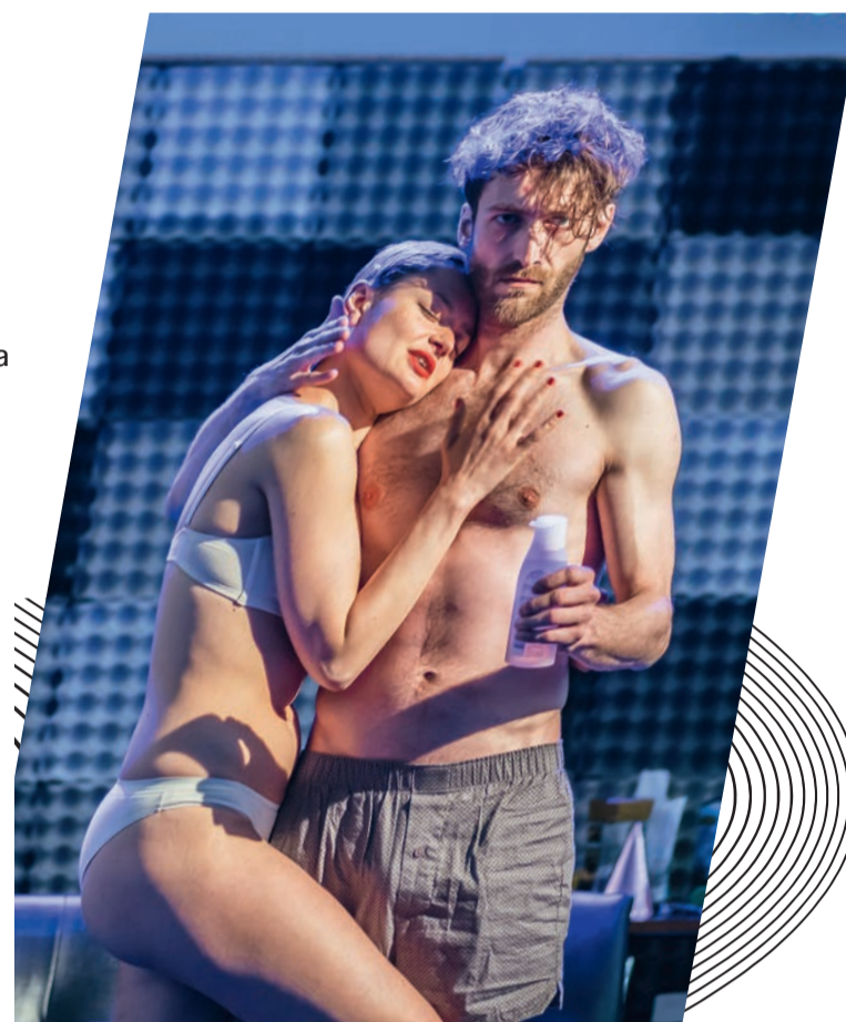
Divadlo Letí Small Town Boy